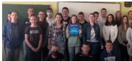
A 8.H osztály – a nyertes projekt zárásakor

A Microsoft segítségével új, modern tanulásmódszertani eljárásokat vezettünk be, projekteken veszünk részt. Hangsúlyt helyezünk a 21. századi elvárásoknak megfelelő kompetenciák fejlesztésére, mint például a kreativitás, a kommunikációs készség, a kooperatív készségek, kritikai gondolkodás.