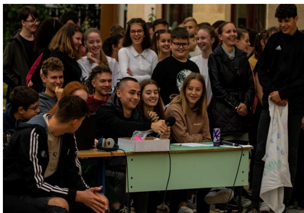
A végzős diákok zsűriként a gólyaavatón 2022. október 29.

Időpontja: 2023. június 21. szerda, melyről értesítést küldünk. Pótbeiratkozás telefonos egyeztetés alapján. Helyszíne: Paksi Vak Bottyán Gimnázium Paks, Dózsa György út 103.